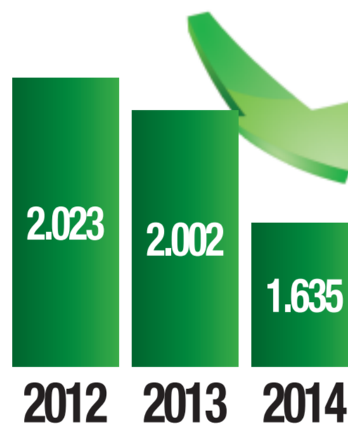
Delitos y faltas cometidos en el municipio de Sestao

A pesar de esta mejoría, desde el PNV no vamos a relajarnos. Todo lo contrario. Continuaremos trabajando con rigor y responsabilidad para que estas cifras sean cada vez mejores, y para que poco a poco la sensación de seguridad aumente. Ese es el compromiso que adquirimos y por el que trabajamos todos los días.